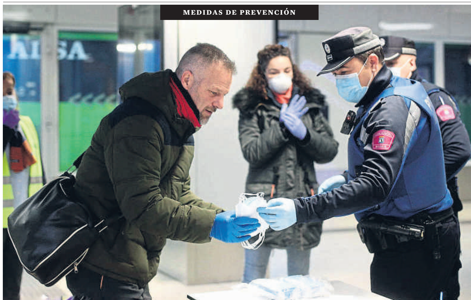
MEDIDAS DE PREVENCIÓN